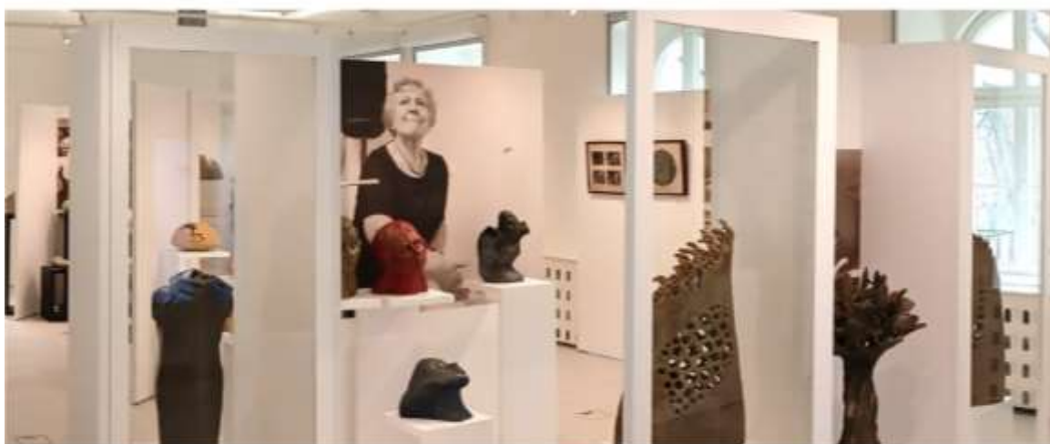
Wystawa "Kobiety wymiar rzeźby", Bolesławiec, 2025