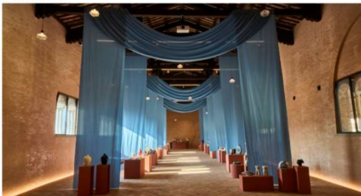
Wystawa podczas festiwalu Argilla Italia w Faenzie, 2024