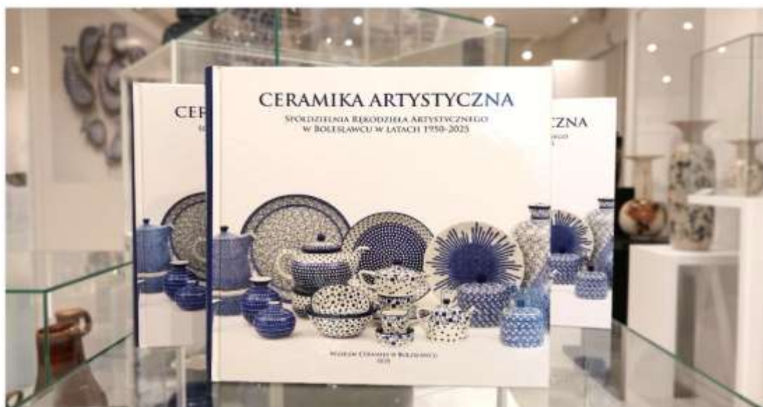
Publikacja „Ceramika Artystyczna Spółdzielnia Rękodziela Artystycznego w Bolesławcu w latach 1950-2025”