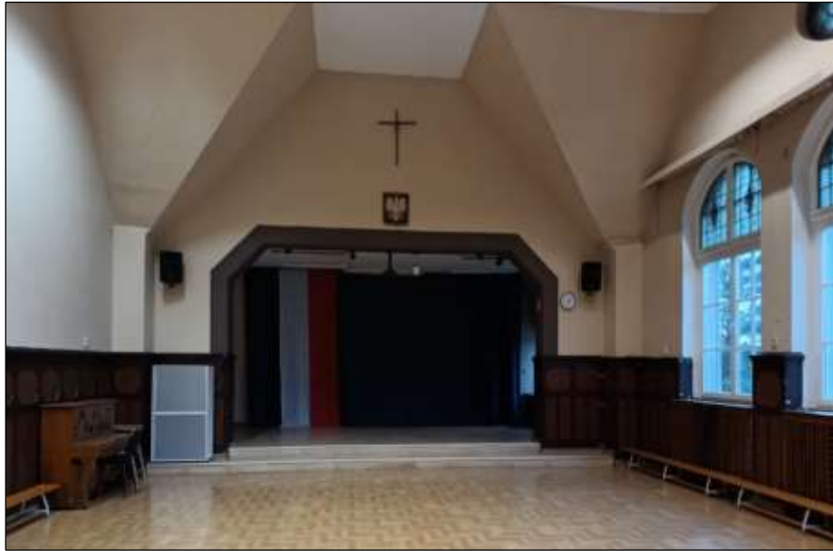
- po renowacji