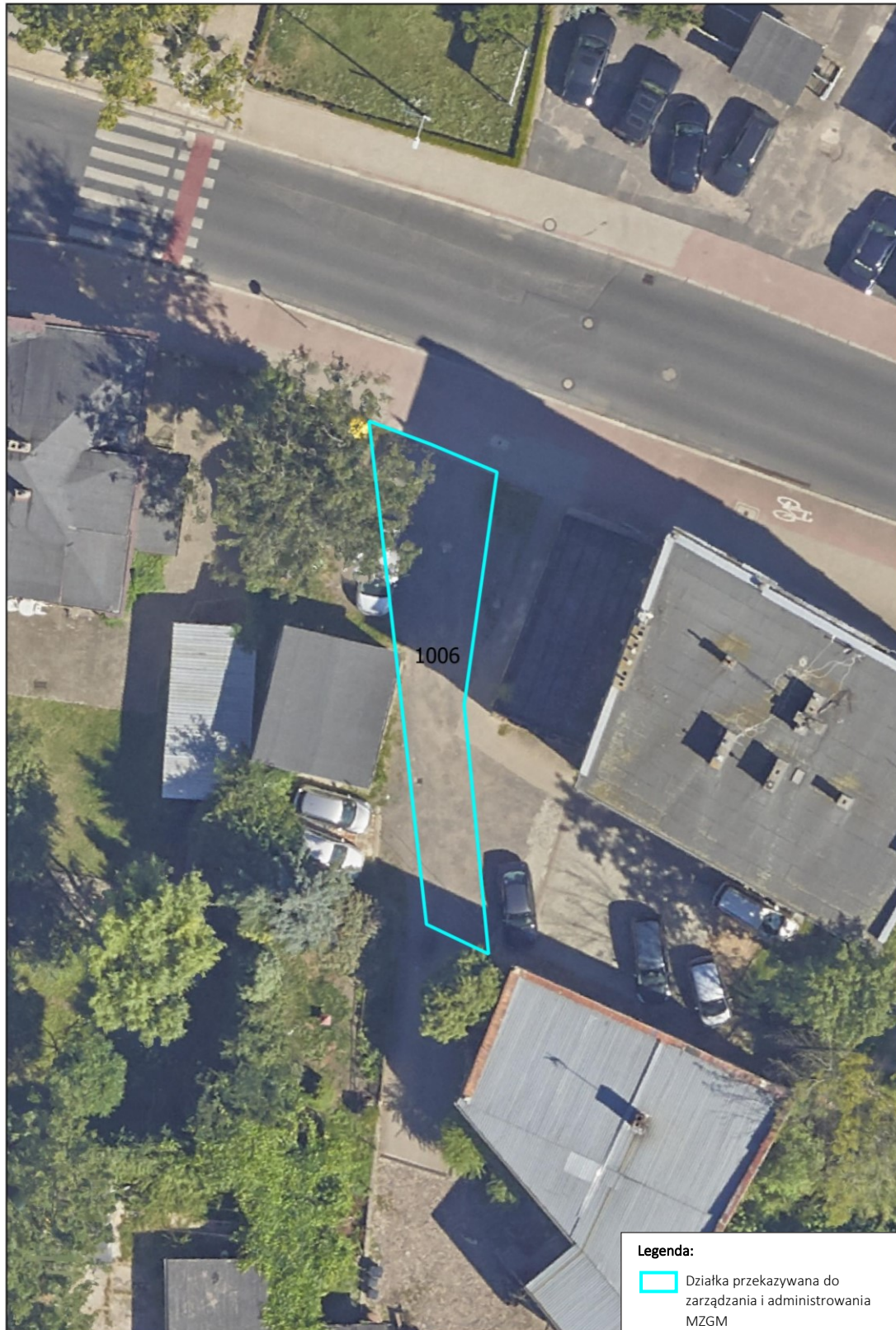
Mapa terenu w obrębie ewidencyjnym 0009-Bolesławiec-9