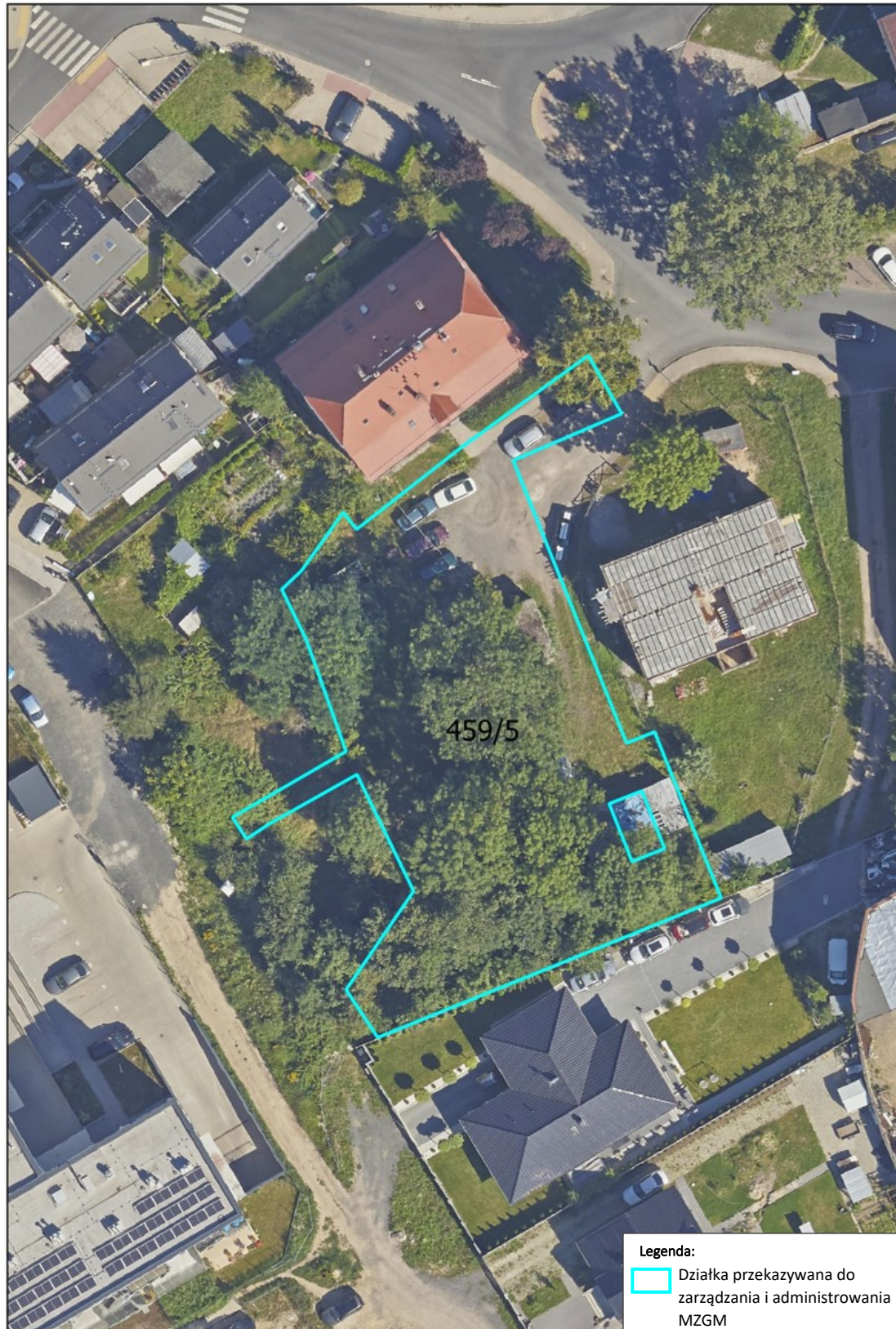
Mapa terenu w obrębie ewidencyjnym 0008-Bolesławiec-8