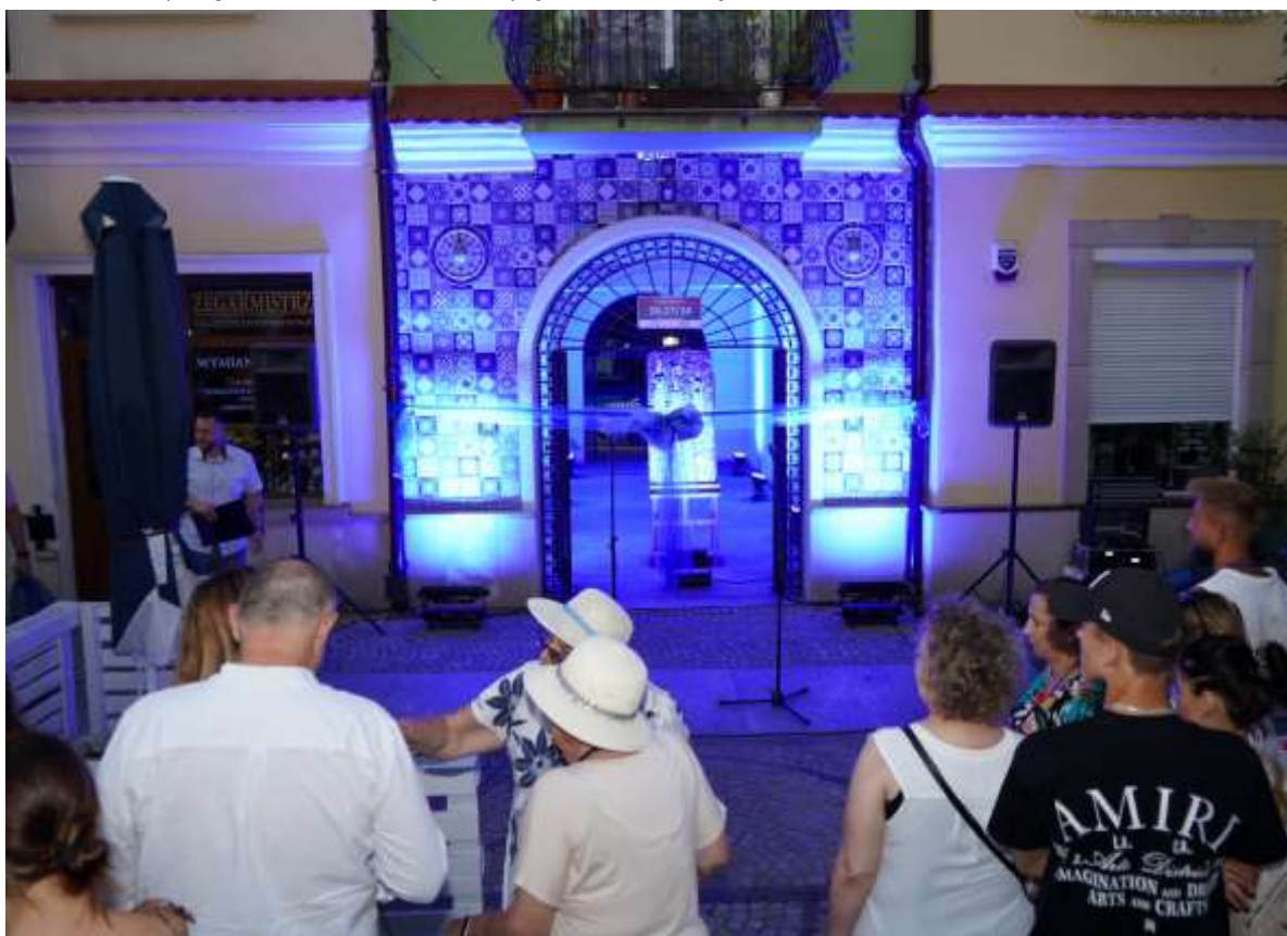
Odświeżenie „Bolesławieckiej Bramy Przyjaźni” przy ul. Bolesława Prusa 26/27/28