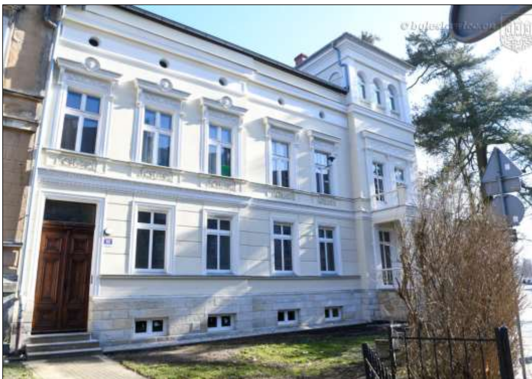
- po renowacji

Remont elewacji kamienicy przy ul. Karola Miarki 23: