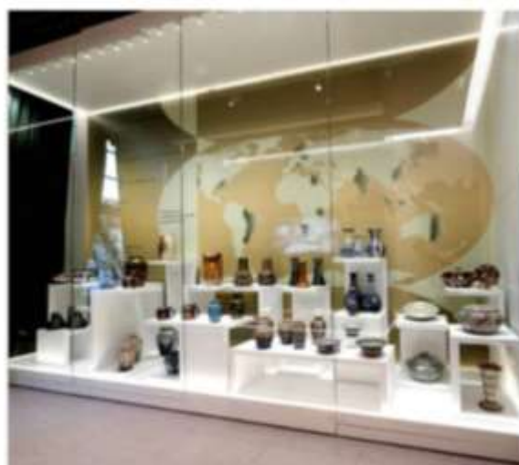
Wystawa stała w Muzeum Ceramiki