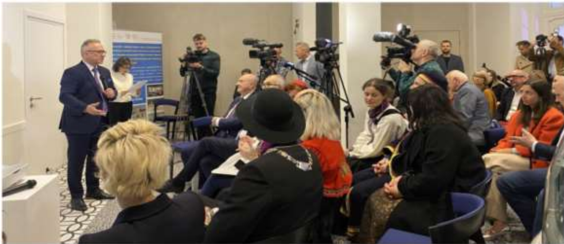
Konferencja prasowa podczas otwarcia nowej siedziby Muzeum Ceramiki