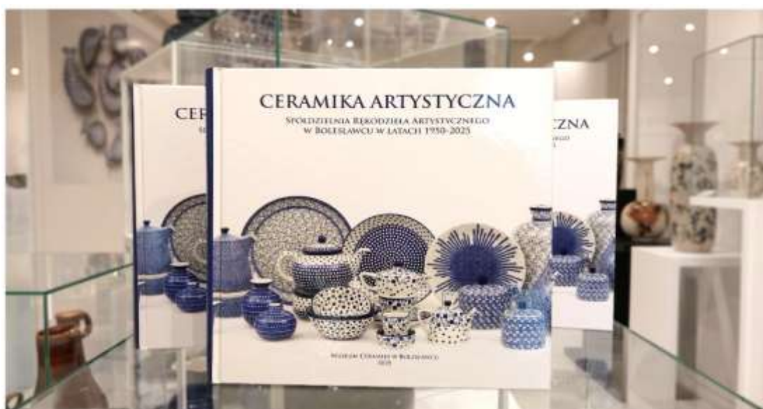
Publikacja „Ceramika Artystyczna Spółdzielnia Rękodziela Artystycznego w Bolesławcu w latach 1950-2025”