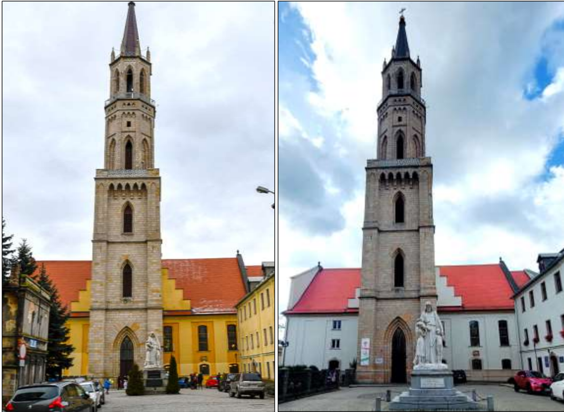
- przed i po renowacji

Prace remontowe w zabytkowej auli szkolnej Zespołu Szkół Zakonu Pijarów w Bolesławcu: