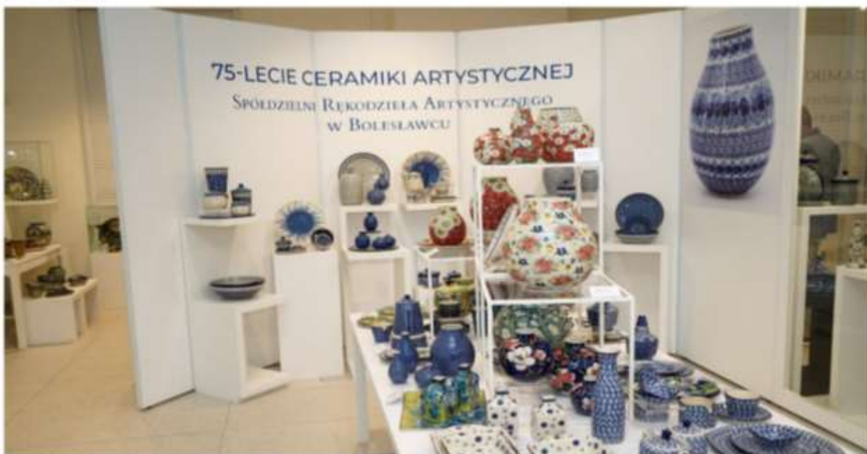
Wystawa „Jubileusz 75-lecia Ceramiki Artystycznej Spółdzielni Rękodzieła Artystycznego w Bolesławcu”, 2025