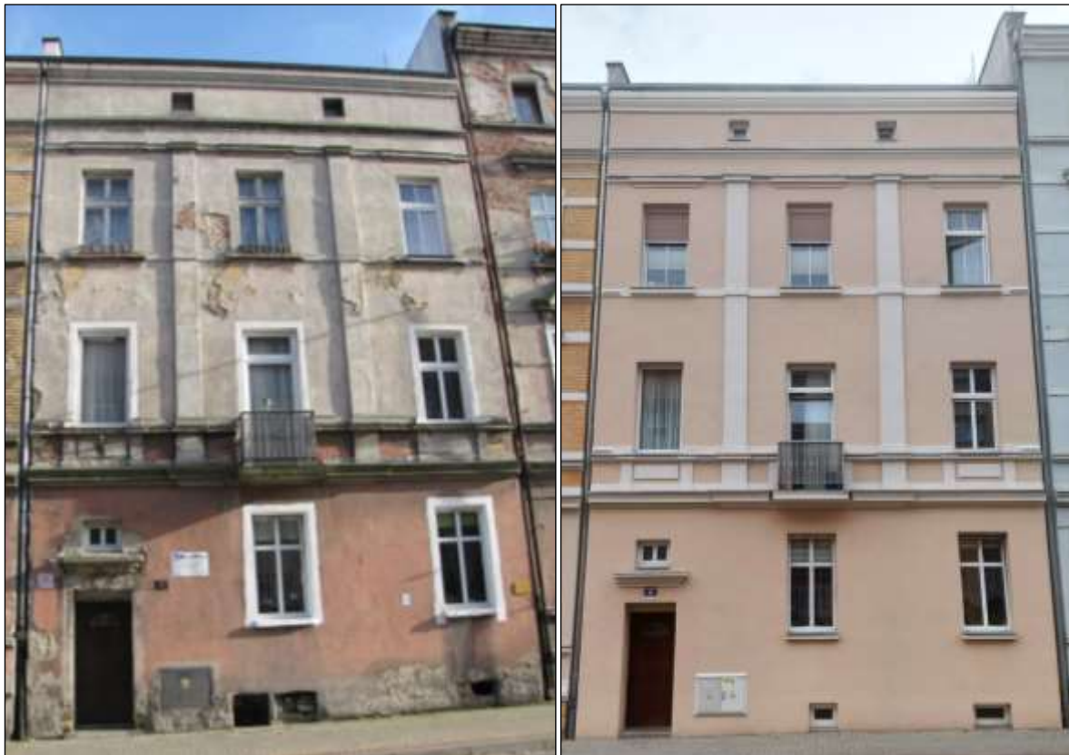
- przed renowacją i po renowacji

Remont elewacji kamienicy przy ul. Karola Miarki 23: