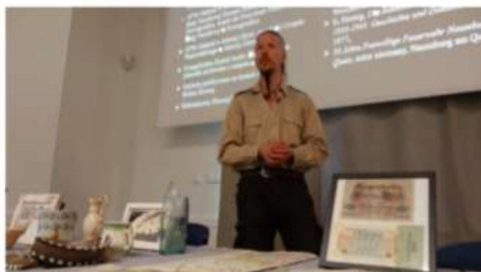
„Feniks powstaje z popiołów. Historia dawnego klasztoru w Nowogrodźcu i jego odbudowy” - otwarte spotkanie z działaczami Fundacji „Twoje Dziedzictwo”