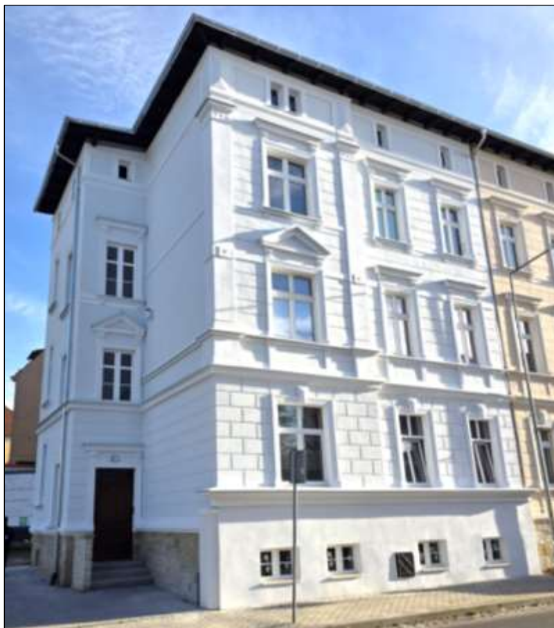
- po renowacji