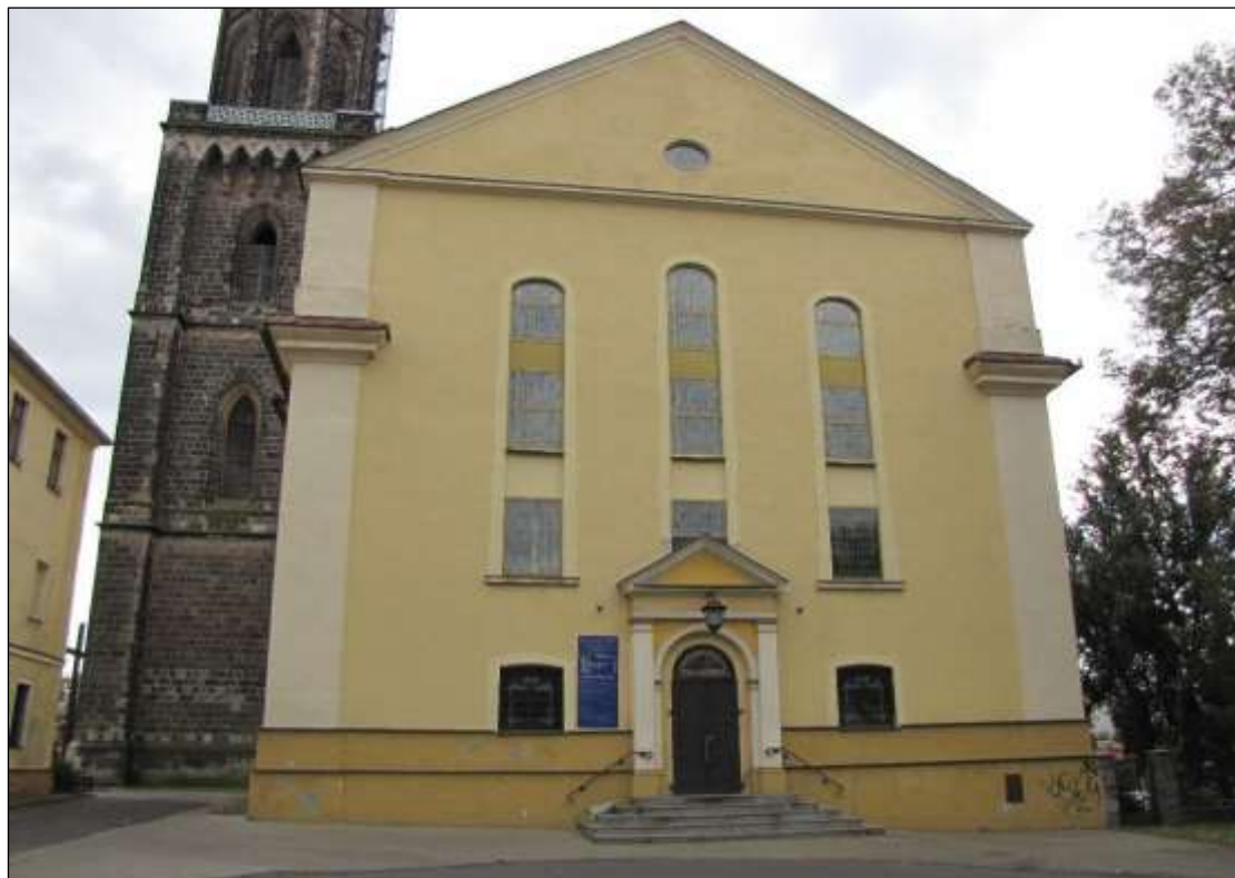
- przed renowacją

Prace remontowe Kościoła pw. Matki Bożej Nieustającej Pomocy przy placu Zamkowym w Bolesławcu: