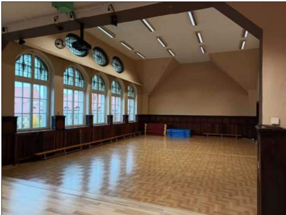
- przed renowacją

Prace remontowe w zabytkowej auli szkolnej Zespołu Szkół Zakonu Pijarów w Bolesławcu: