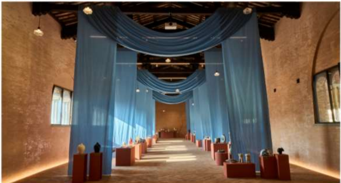
Wystawa podczas festiwalu Argilla Italia w Faenzie, 2024