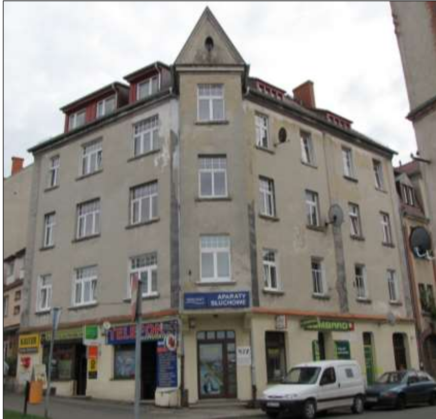
- przed renowacją

Remont elewacji kamienicy przy ul. Piaskowej 9: