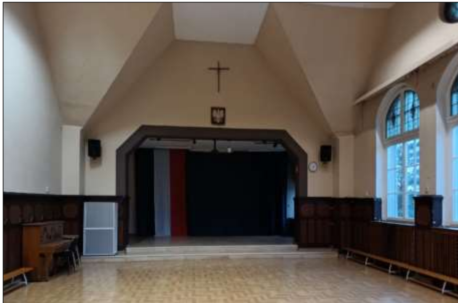
- po renowacji