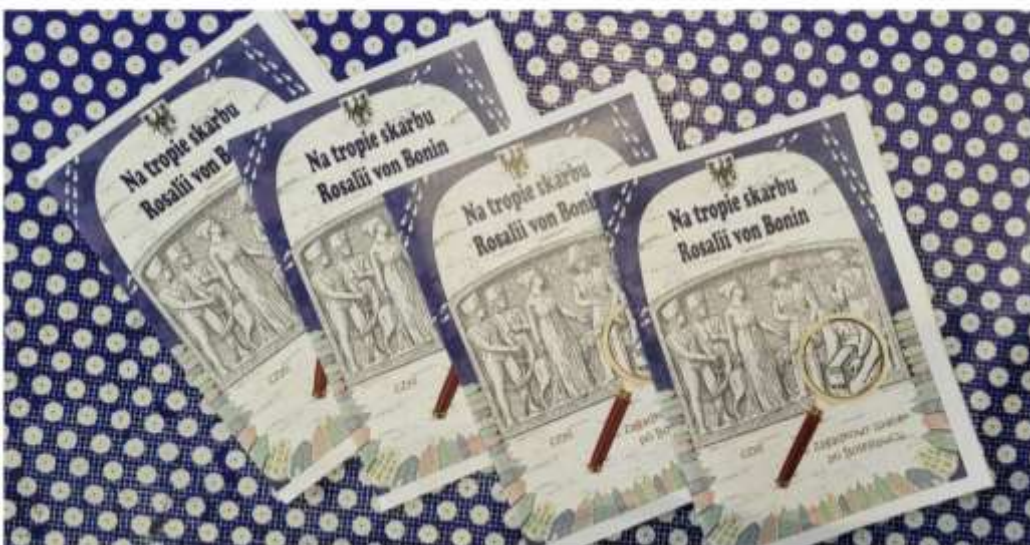
Ulotka do gry miejskiej „Na tropie skarbu Rosalii von Bonin”