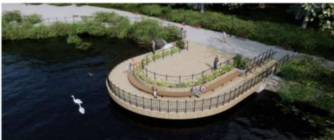
Projekt pomostu na Stawie Miejskim przy ul. Bolesława Kubika