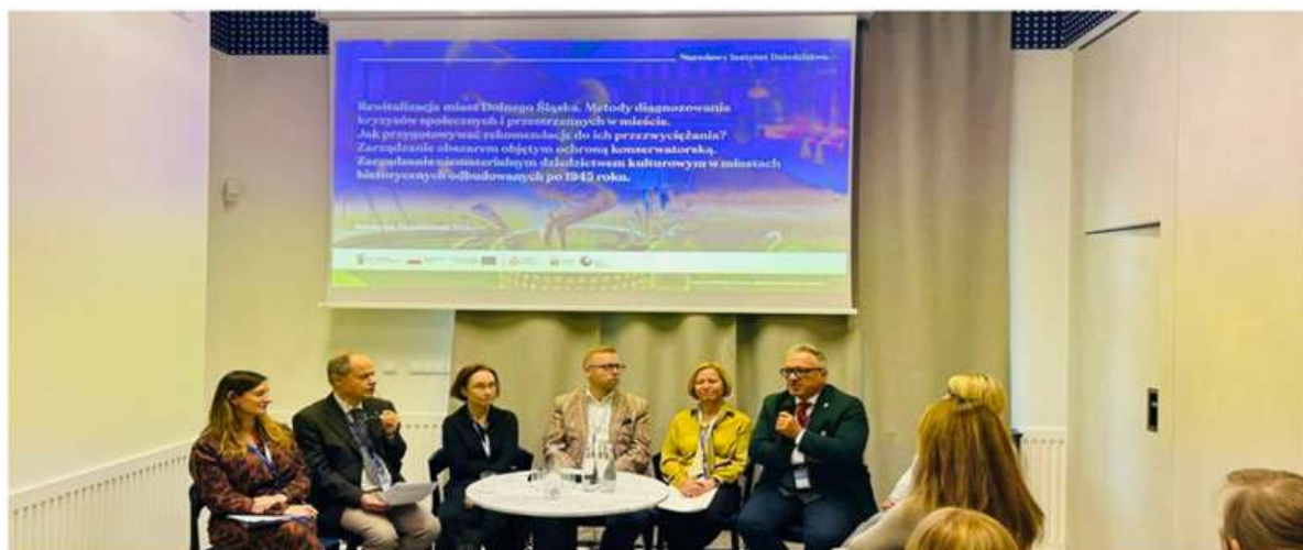
Ogólnopolska konferencja „Rewitalizacja na obszarach miast historycznych odbudowanych po 1945 roku”