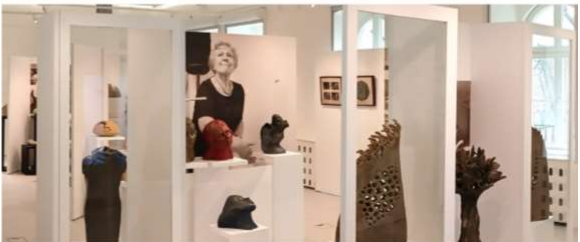
Wystawa "Kobiety wymiar rzeźby", Bolesławiec, 2025