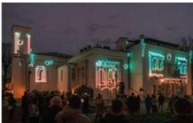
Otwarcie nowej siedziby Muzeum Ceramiki