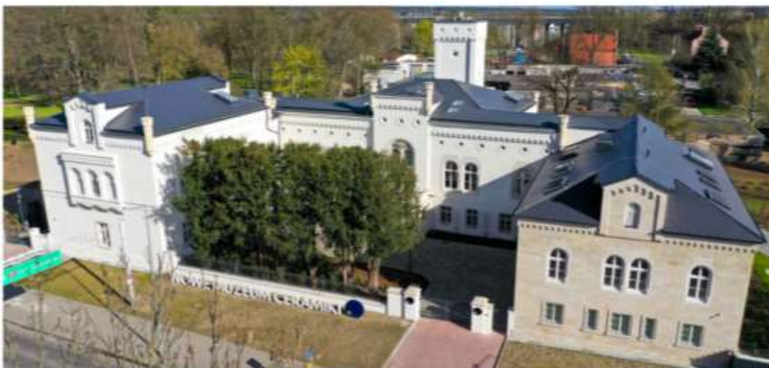
Nowa siedziba Muzeum Ceramiki