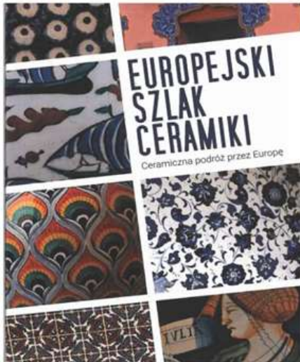
Publikacja "Europejski Szlak Ceramiki"