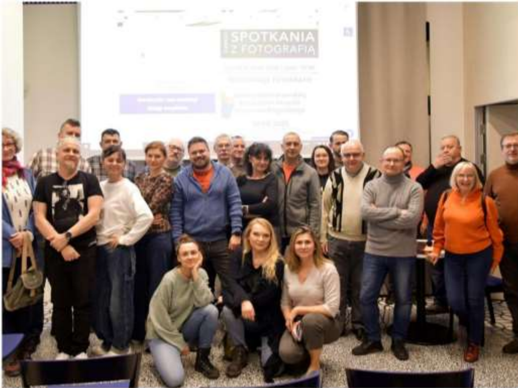
Fotomaraton „Z aparatem przez Bolesławiec”