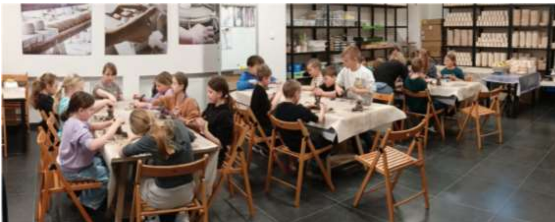
Warsztaty ceramiczne w Centrum Dawnych Technik Garncarskich