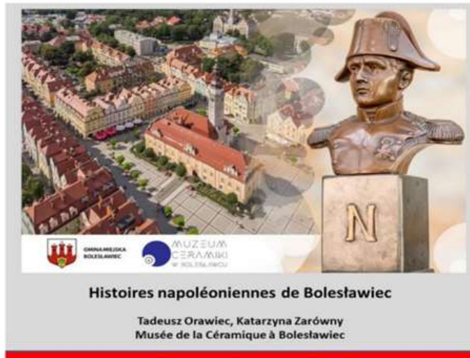
Międzynarodowa konferencja „Muzea i pola bitewne”, Sorbona, Paryż, 2024