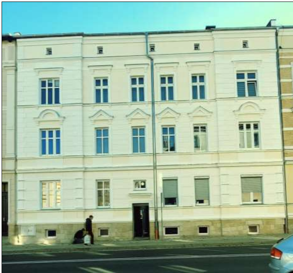
- po renowacji