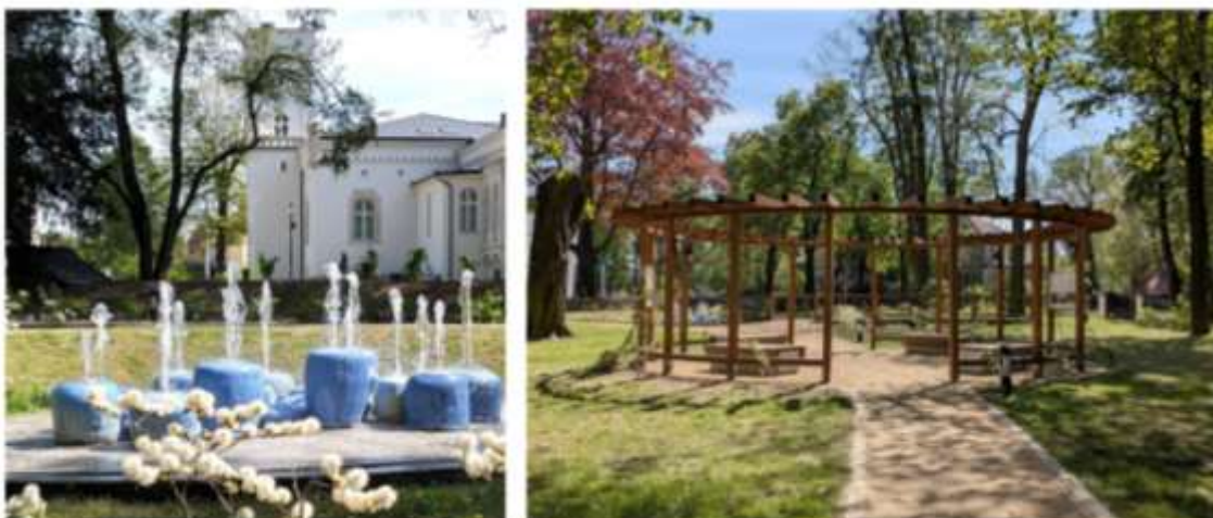
Park przy ul. Zgorzeleckiej po rewitalizacji