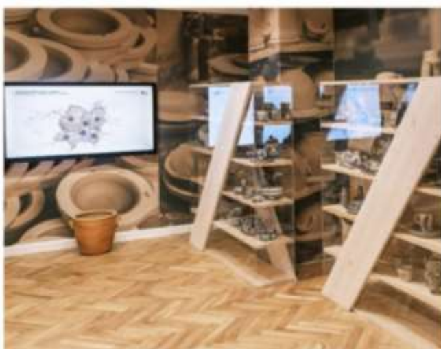
Wystawa stała w Centrum Dawnych Technik Garncarskich