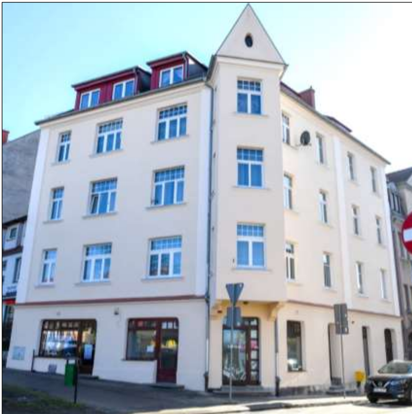
- po renowacji