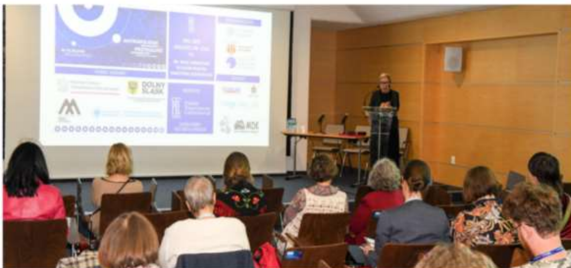
Ogólnopolska konferencja „Antropologia przyszłości, przyszłość antropologii”