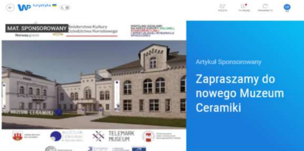
Artykuł promujący nową siedzibę Muzeum Ceramiki na ogólnopolskim portalu "Wirtualna Polska"