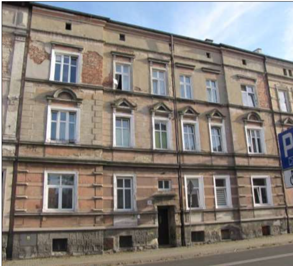
- przed renowacją

Remont elewacji kamienicy przy ul. Karola Miarki 25: