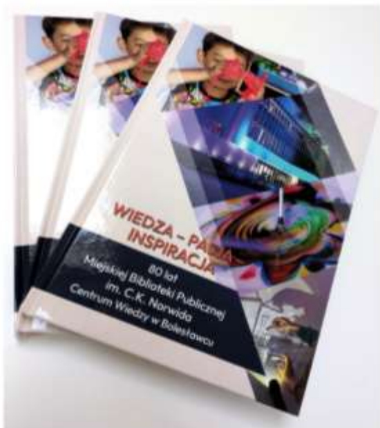
Publikacja „Wiedza - Pasja - Inspiracja. 80 lat Miejskiej Biblioteki Publicznej - Centrum Wiedzy w Bolesławcu”