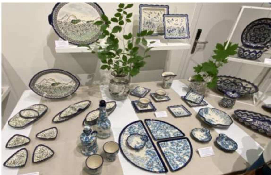
Wystawa "Współczesne wzornictwo ceramiki bolesławieckiej", Bolesławiec, 2024

Wspieranie wydawnictw i publikacji poświęconych historii miasta oraz jego zabytkom: