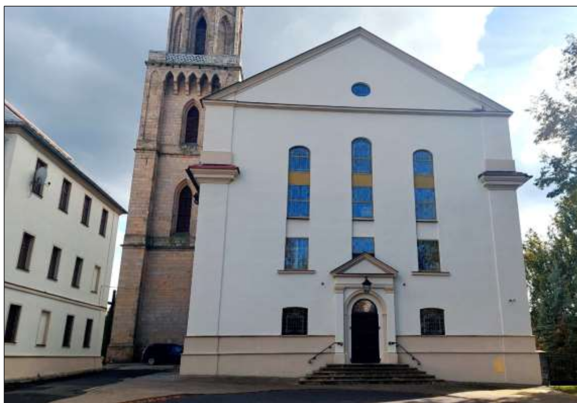
- po renowacji