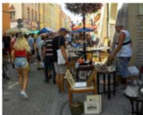
Bolesławiecka Giełda Staroci