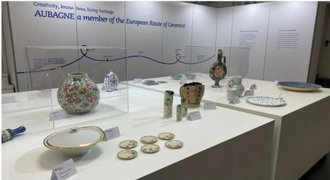
Wystawa prezentująca ośrodki zrzeszone w Europejskim Szlaku Ceramiki podczas festiwalu ceramiki Argilla France w Aubagne