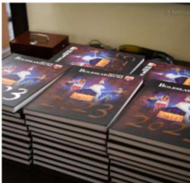
Periodyk „Rocznik Bolesławiecki 2023”