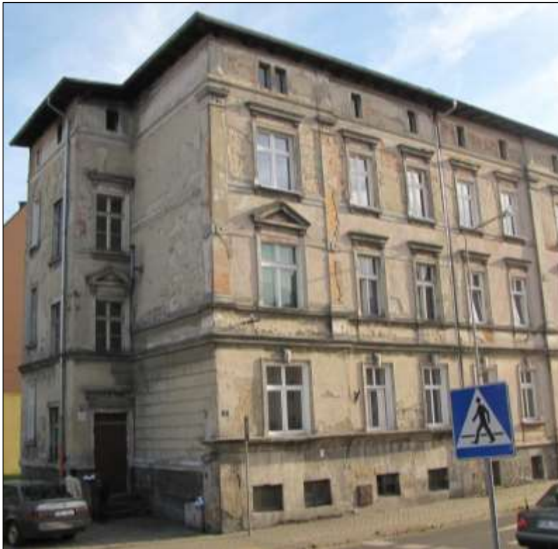
- przed renowacją

Remont elewacji kamienicy przy ul. Karola Miarki 27: